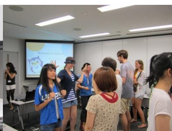
ウェルカムパーティで交流を深める Student activity at the welcoming party