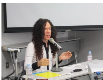
プログラム特別授業 Special Lectures

It is a two-week program to learn pop and traditional culture of Japan in English with 25 students from all around the world!