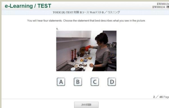
問題画面 ( Part1 写真描写問題 )

「WebテストB」リスニング対策教材例 (TOEICスコア500～600点対象)