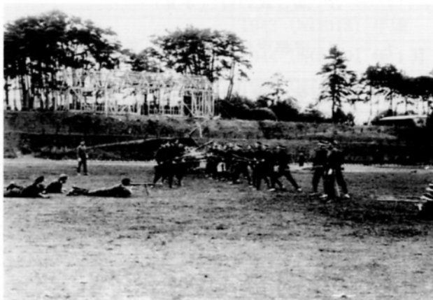
軍事教練のようす（1940年）