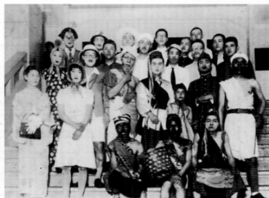
慰問演芸・「マライの虎」の脚本と公演写真（1942年）

〔編集・発行〕 明治大学史資料センター事務室 〒101-8301 東京都千代田区神田駿河台1-1 TEL 03-3296-4329 FAX 03-3296-4086 明治大学史資料センターURL http://www.meiji.ac.jp/history/ 〔発行日〕 2006年7月1日 〔印刷〕 二葉印刷有限公司