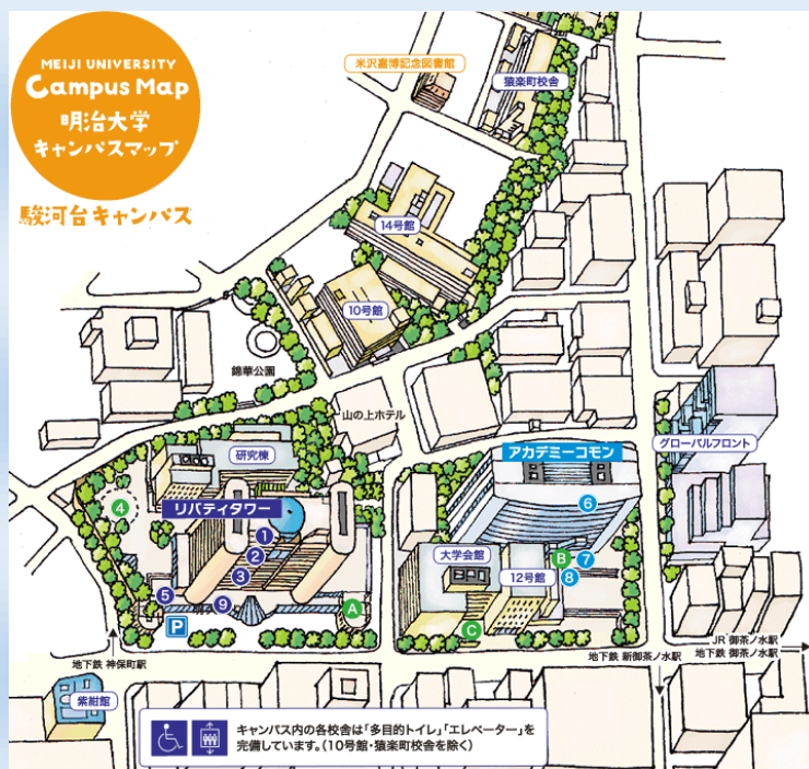
駿河台キャンパスマップ