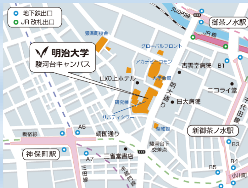
明治大学駿河台キャンパスへのアクセスマップ