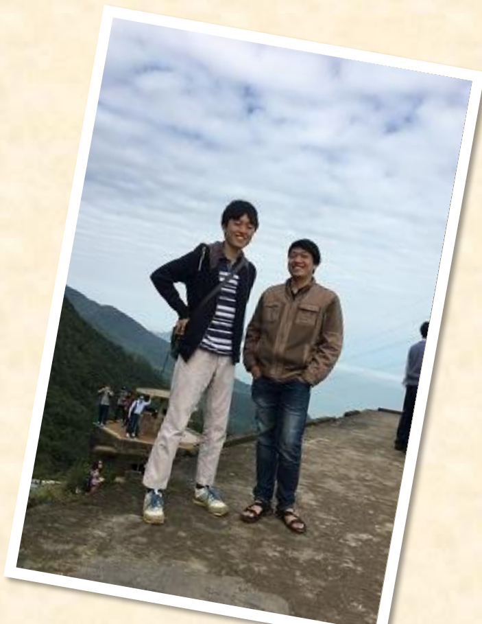
ハイバン山の山頂