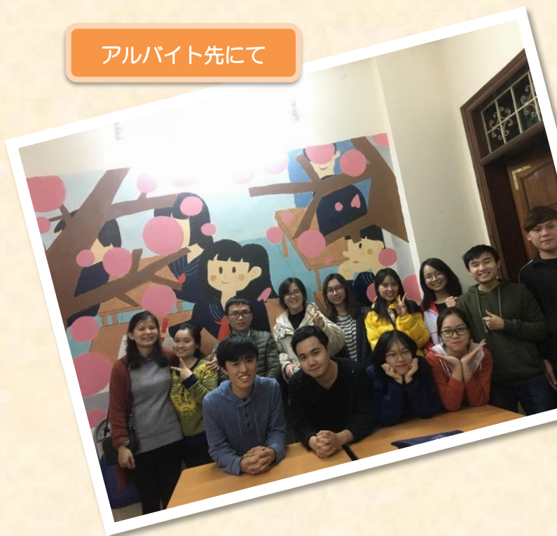
アルバイト先にて