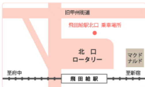
京王線飛田給駅北口ロータリー内