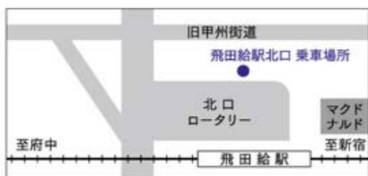
飛田給駅バス乗降場所