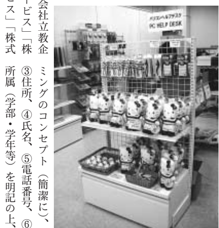
▲明大マート駿河台店の明大グッズ売場

ご父母のみならずにも、同社が学校法人明治大学の関連会社であること明かに理解されるような社名(商号)に変更することにし、同時に、学生・教職員に親しまれるもの、としたいと考え、学内から広く新社名を募集することになりました。