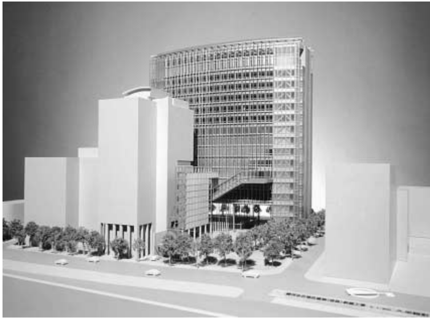
法科大学院の授業が行われるアカデミーコモン (完成予想模型)

サポートするとともに、レポートの添削指導、学生の自主学習の相談など個別指導を行うことを予定している。また、短期間で基礎から実務にわたる法曹養成教育を高めるべく行うため、学生の予習復習は欠かせないことから、eラーニング自主学習システムを新たに開発し、学生による自主学習と授業との一体化を図りつつ教育を展開する。このため、学生一人ひとりの学習機には、eラーニング自主学習システムや法令・判例・文献情報CDなどといったも接続できるように情報コンセントを用