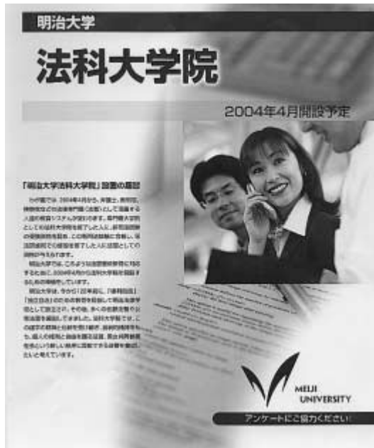
学内のラックで配布しているリーフレット

明治大学では、法曹養成教育に特化した教育を行うために、専門職大学院としての法科大学院の開設を準備している。二〇〇四年四月開設予定であり、そのための準備が着々と進められている。去る三月三十一日には、学長の招集の下、法科大学院の教員として就任を予定されている教員が集まり、説明会と懇談会が盛大に行われ、開設に向けての決意を新たにされた。本年六月末に設置認可申請を行い、一二月末には設置認可される予定になっている。設置認可後、直ちに学生募集を行い、来年一月か二月頃に入学者選抜試験を実施する予定である。 明治大学法科大学院設立は、わが国における法曹養成教育システムの変革に対応するものである。現在、わが国では、学部で二年間在籍し、教養科目などの所定単位を履修した者については、司法試験第一次試験が免除され、第二次試験（択一試験、論文試験、口述試験）に合格し、司法研修所での修習を修了した者に法曹資格が与えられているが、政府の司法制度