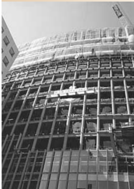
建設が進む駿河台の新校舎・アカデミーコ モンは、2004年4月に使用開始予定 (3月12日の上棟式)