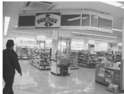
▲サンクス明大生田店

ご父母のみならずにも、同社が学校法人明治大学の関連会社であること明かに理解されるような社名(商号)に変更することにし、同時に、学生・教職員に親しまれるもの、としたいと考え、学内から広く新社名を募集することになりました。