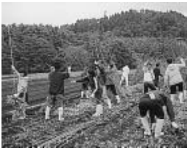
とっくり芋収穫前の作業風景

学生相談室主催の恒例行事「体験・農業 in 富士吉田」が、今年も10月25日(土)～26日(日)の日程で、明治大学富士吉田農場で開催されます。昨年度は、秋晴れの好天気に恵まれ新しい仲間との交流も広がりました。その昨年度の参加者から体験記が寄せられています。学生相談室では、このような交流と出会いの場を折りに触れて企画しています。あなたもぜひ参加してみませんか。(学生相談室)