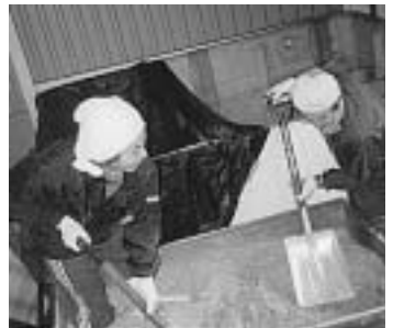
飼料のサイレージ作業

いてみると、この林檎も農業は使わず、肥料と人の手で育てていたものと伺いました。お店に置いてある林檎とは確かに違いましたが、味は天下一品、しゃくしゃくと噛めば甘さがじんわり広がり、もぎたてということもあり、非常に美味しかったです。