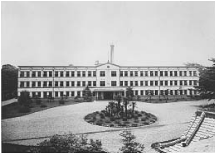
予科校舎 (旧中央校舎)