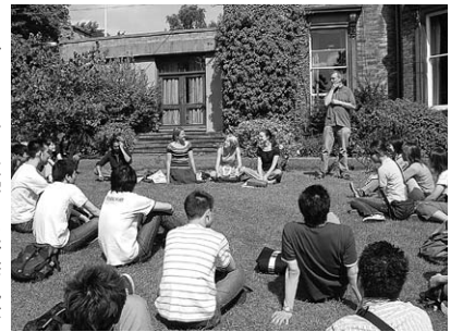
シェフィールド大学での研修風景