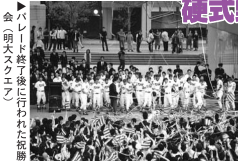
パレード終了後に行われた祝勝会(明大スクエア)

発行 明治大学 編集 明治大学広報部 TEL 03 (3296) 4083 E-mail: koho@mics.meiji.ac.jp 東京都千代田区神田駿河台1-1 (〒101-8301) http://www.meiji.ac.jp/