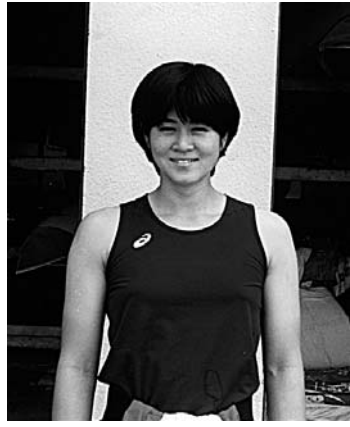
▶端艇部初の女性部員(入学当時)

第3回目は、カヌーをはじめたきっかけと、合コンに行く暇もなかった学生生活について振り返りたいと思います。 これまで聞いたこともなかったカヌーというスポーツを始めたのは入学した高校がたまたま川のほとりに建っていたから。毎日珍しい船が川に浮いているのを見かけ、新入生試乗会に参加したのがきっかけでした。そこで「日本代表」という、幸か不幸か、これまで聞いたこともない言葉を耳にし、入れば外国