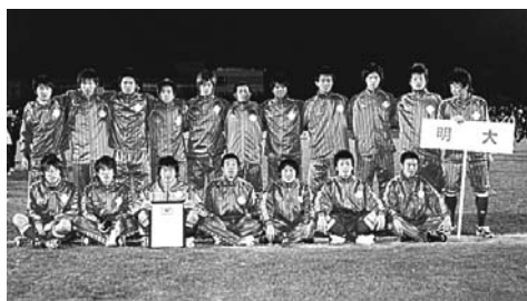
一部昇格を決めた明大イレブン

サッカー部が一部昇格 関東大学サッカーリーグ2部 関東大学サッカーリーグ2部の全日程が終了し、明大が2位で1部昇格を決めた(4位までが1部昇格)。