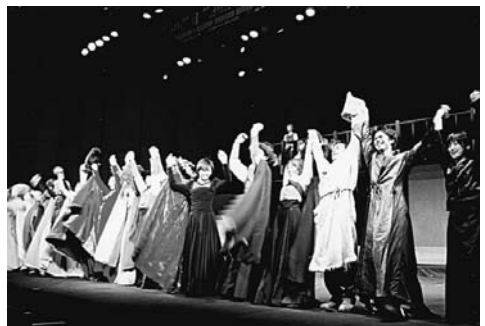
カーテンコールに応える学生たち

9月も末に決った実施に向けて、稽古もさることながら、制作全体にわたる準備作業は大重だった。各学部からの諸君が分担して、ポスター、チラシ、パンフの制作、チケット予約、宣伝等々、多岐に及ぶ作業に奮闘した。