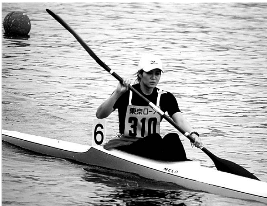
▶3年時に出場した全日本選手権

入学当時は半年間入る部屋がなく、キャンピングカーを借りて駐車場に住むことになり、見栄を張って入学したことを後悔して眠れず、毎日泣いて暮らしていたことが懐かしく思い出されま そんな生活も半年もする頃にはすっかり慣れ、ポート仲間、30名の男たちとの共同