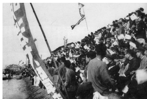
隅田川端艇競漕会の応援風景

「④白熱党歌」は、大正デモクラシー期の学生運動の中で雄弁部員が組織した党の団結歌で、校歌のさきがけをなすともいわれる。