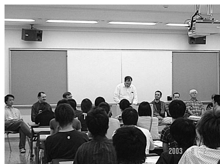
講師はネイティブ・スピーカー