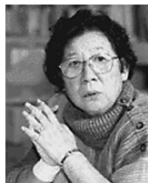
(おさない・みえこ)

代表作に「3年B組金八先生」(TBS)、「徳川家康」(NHK大河ドラマ)など多数。 NPO法人「JHP・学校を作る会」代表。