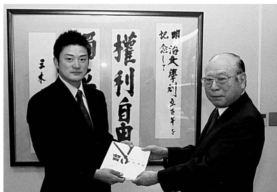
プロになったのも、指導者やチームに恵まれたから(明大に300万円を寄付)