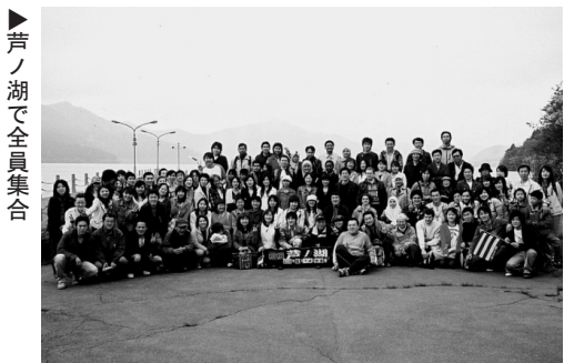
▶芦ノ湖で全員集合

初めてメガロポリスに住む人には東京で生きるのとは簡単ではない。東京の人口は1200万人、面積が2200km 2 で、それぞれパリと比べると人口は6倍、面積が25倍です。日本人は毎日の生活で自然と関係を保つことができますけれども、私の場合には絶対に違いました。東京では公園がたくさんありますが、同じ感じではありません。日本に来てから2ヶ月間緑を見ませんでした。