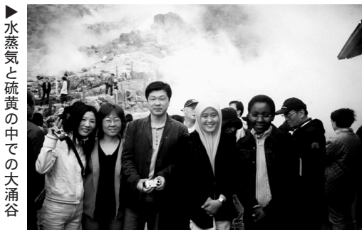
▶水蒸気と硫黄の中での大涌谷