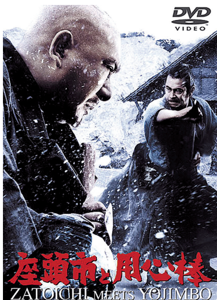
岡本喜八監督『座頭市と用心棒』 DVD発売中 ¥5,040(税込) 発売・販売元：東宝