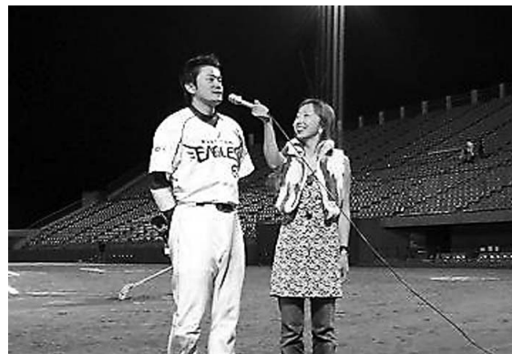
本拠地最終戦でヒーローインタビューを受ける

プロ1年目のシーズンが終了しました。シーズン当初は体調が思わしくなく、夏場になってようやく二軍の試合に出場できるようになりました。初打席は「やっと打席に立てる」ということですごく嬉しかったです。プロのピッチャーとアマチュアのピッチャーの違いは、やはりコントロールと変化球のキレ。そして、何よりプロはすべてのプレーのスピード感が違うと感じました。体力的にはまだまだ足りない部分があるので、強化していかないといいませんが、技術的には今まで積み重ねてきたことが間違っていないことを実感することができました。一軍の舞台で活躍するためには、実践経験をたくさん積んで、バッティングも守備も安定感を出していかなければいけないと感じています。