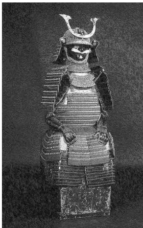
伝内藤義概所用紫糸威二枚胴具足

2005年度の特別展では、三河時代から徳川家の武将として戦を重ね、ついには7万石の大名となった譜代大名内藤家を取り上げます。内藤家は延享4(1747)年に陸奥国磐城平から日向国延岡へ居城を移し、その地で幕末を迎えました。今回は、内藤家の歴史を記した内藤家文書(明治大学博物館蔵)と、天下一能面などの内藤家の大名道具(内藤記念館蔵)を組み合わせ、武士であり、治者であり、文化人であった江戸時代の大名の姿を描きます。金工・漆工・染織などの工芸技術を駆使した装飾性豊かな「伝内藤義概所用紫糸威二枚胴具足」など、展示される大名道具の多くが東京では初の披露となります。