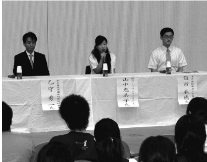
▶卒業生が自らの体験を語る

で、実際に何をしたらよいかかわからないし、その上、自分が何の仕事に就きたいかもじっくり考えたことがなく、不安でいっぱいでした。まずは、他の人の体験談を聞きたい。そう思っていた時に文