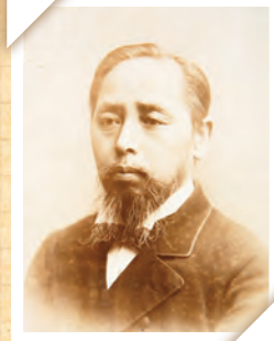
日本法律学校学祖 山田 顕義