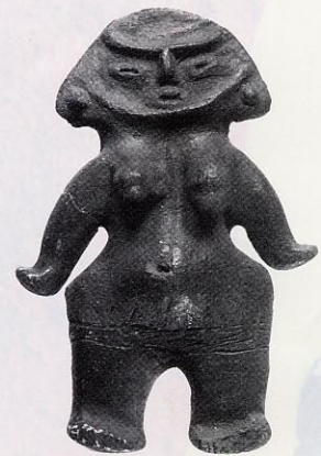
妊娠を示す土偶（明治大学博物館蔵）