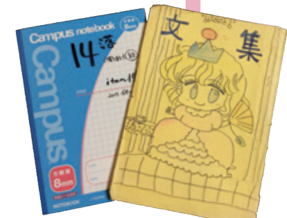
幼いころの文集（表紙に愛読のマンガを模したイラストが 入っている）および「昭和元禄落語心中」ネームノート