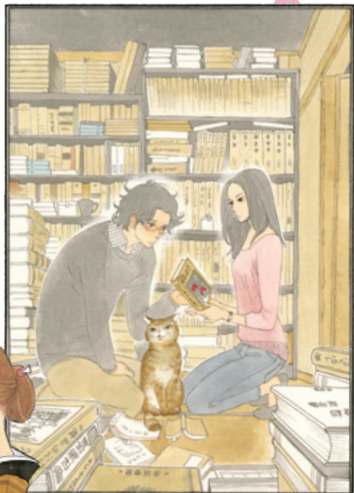
「舟を編む」タイトルロゴイラストおよび 連載第5話のカットより