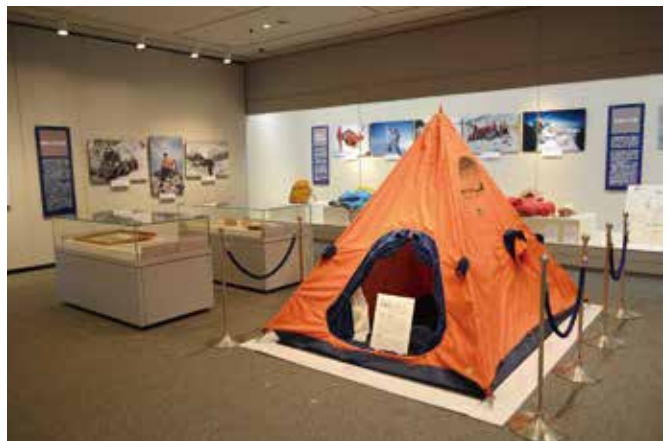
冒険家・植村直己 単独行 (2015年度～2016年度)