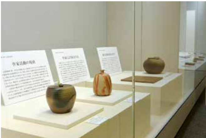
備前焼の新たな価値創造