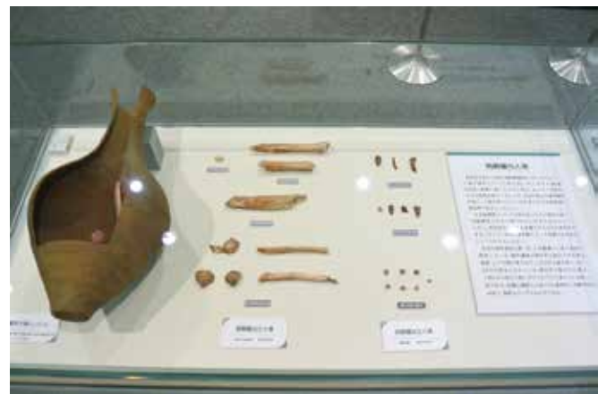
企画展「再葬墓と甕棺墓」(5)