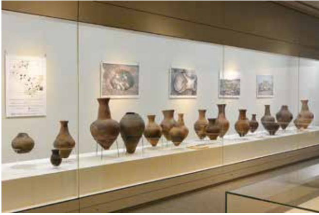
新収蔵・収蔵品展 2016