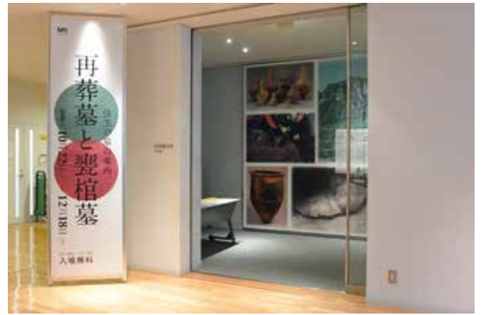
企画展「再葬墓と甕棺墓」(1)