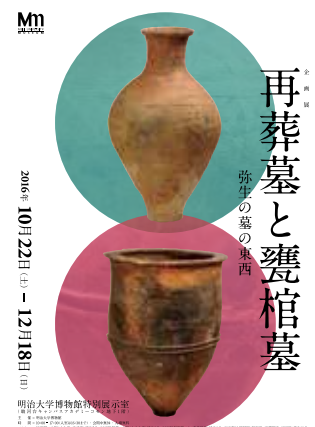
企画展「再葬墓と甕棺墓」ポスター