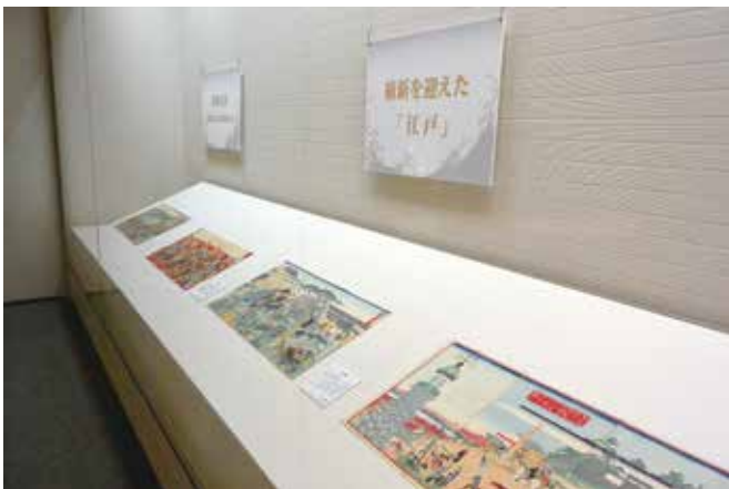
江戸から東京へ—錦絵に見る日本近代の曙—