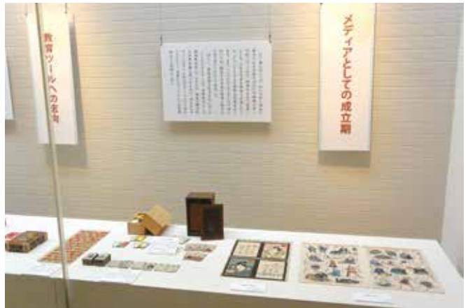
メディアとしてのカルタ —時田昌瑞ことわざコレクションから—