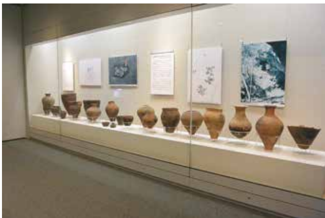
企画展「再葬墓と甕棺墓」(4)