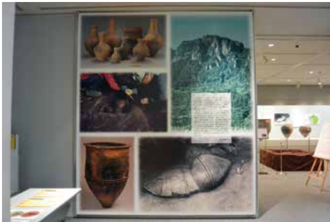
企画展「再葬墓と甕棺墓」(2)