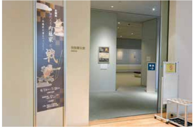
譜代大名内藤家と戦—内藤家文書をつうじて—