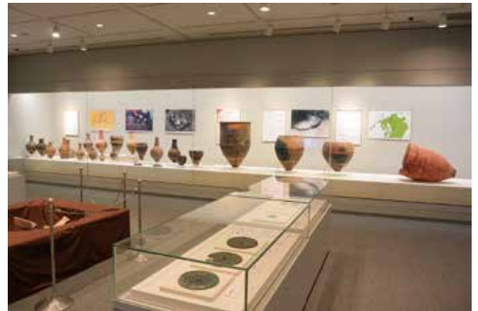
企画展「再葬墓と甕棺墓」(3)