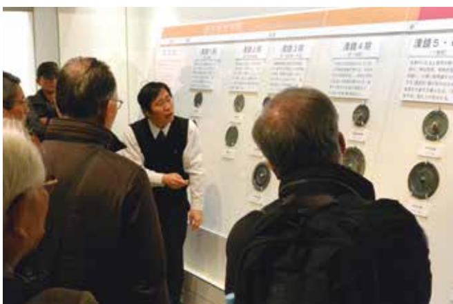
企画展「再葬墓と甕棺墓」(6)