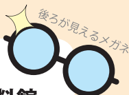
後ろが見えるメガネ