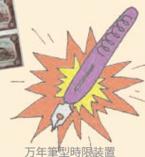
万年筆型時限装置

※以下のイラストは、ぜんぶ登戸研究所で研究していたものです 夏休みの自由研究にもピッタリ♪ どなたでも参加できます