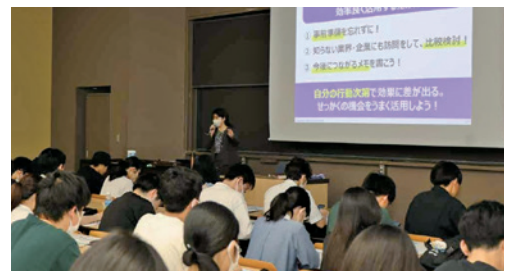
企業担当者によるパネルディスカッション

学生の就職活動を支援するため、政治経済学部独自のイベントを学内で開催しています。例年、様々な分野で活躍する本学部のOB・OGを招いた懇談会では、卒業生ならではの貴重なお話を聞くことができるとともに、学生自身が積極的に質問し、就職活動に対する見分を広げ、意識を高める貴重な機会となっています。