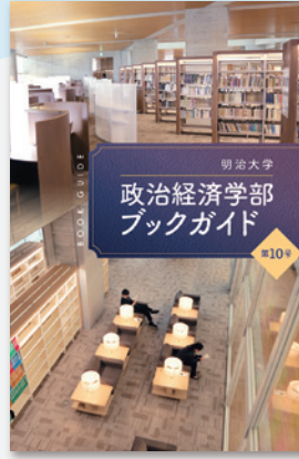
政治経済学部ブックガイド

「政治経済学部での大学生活について、現役の学部生による生きた情報をわかりやすく、親しみやすく伝えたい!」ということをコンセプトに作成しています。