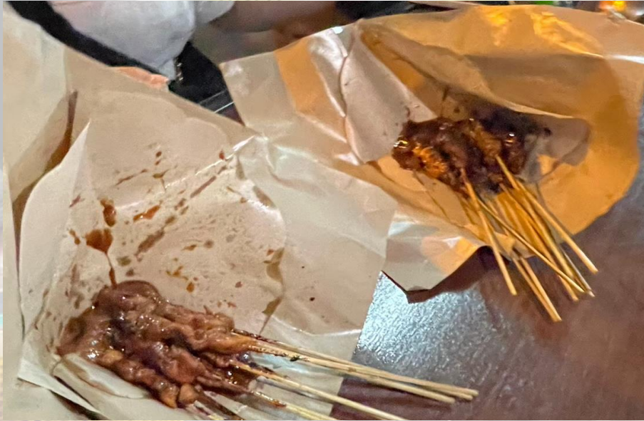
サテ・アヤム（鳥の串焼き）