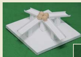
「何でも吸引四方向滑り台」 (2010年の国際錯覚コンテスト優勝)

錯覚は、普段は生活に役立っている知覚機能が、特別の環境で極端に現れる現象です。この錯覚を研究することは、知覚機能を正面から研究することでもあります。錯覚の仕組みを、数理モデリングを通して理解し、生活に役立てる研究をしています。数理を使う利点は、錯覚の効果を数量化できるところにあります。もう一方で、知覚の柔軟さと数学の厳密さをいかに融合できるかが、成功の鍵となります。