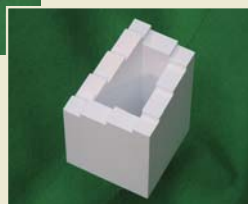
「エッシャーの無限階段」

だまし絵立体のトリックについては、 http://home.mims.meiji.ac.jp/~sugihara/hobby/hobby.html をご覧ください。