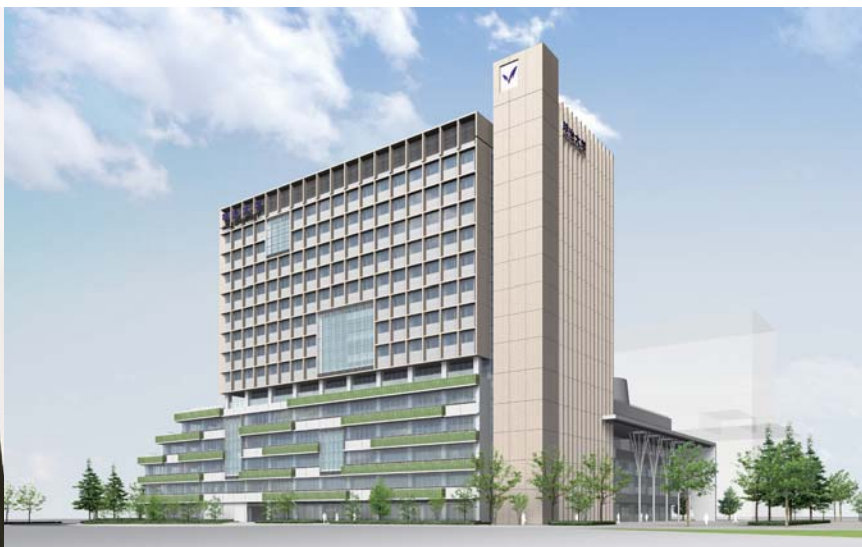
中野キャンパス整備計画(第1期工事)外観イメージ(※CGによる完成イメージ、色や形等、施工時は異なる場合があります。) 先端数理学研究科は2013年4月に、生田キャンパス(小田急線生田駅)から中野キャンパス(JR中央・総武線、東京メトロ東西線中野駅)に移転します。