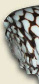
自然界の模様のメカニズムをコンピュータシミュレーションで解析します。

貝殻の中には美しい模様があり、その模様は、どのようにして形成されたのか。実は、偏微分方程式を用いて解析することができます。また、模様の形成のメカニズムも、模様作りの普遍性があります。コンピュータシミュレーションと組み合わせによって、生物の形作りの仕組み