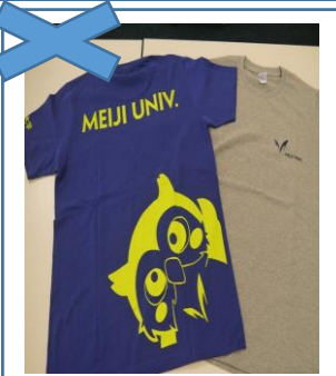
ボタン・刺繍・金具・プリントのついている Tシャツ

更衣室は大変混み合います。 検査後は速やかに退出し お待ち合わせなどは ご遠慮ください