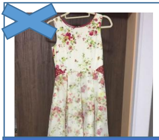
脱ぎにくさ NO. 1