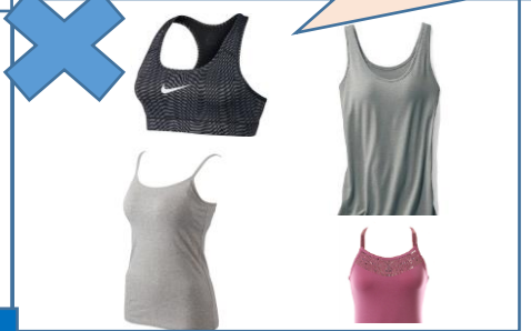
金属アジャスターやラインスト ーンチャーム付き NG！