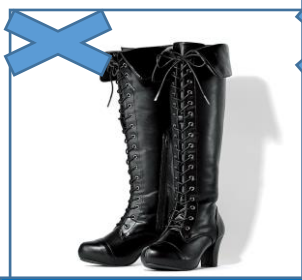
時間がかかる NO. 1