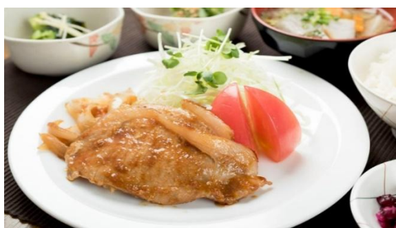
健康的でおいしい食事