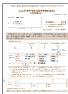
(採用候補者決定通知)