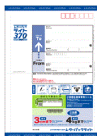
(返送用レターパックライト)