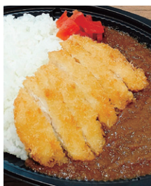
※写真はカレーの一例です。