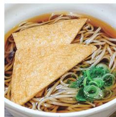
※写真は麺メニューの一例です。