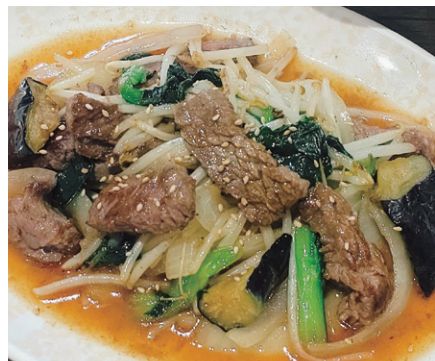
※写真は定食メニューの一例です。