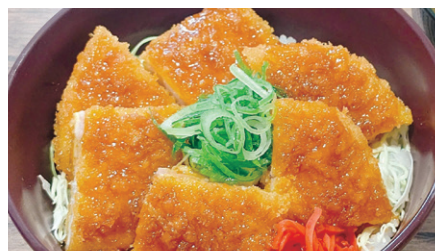
※写真は丼メニューの一例です。