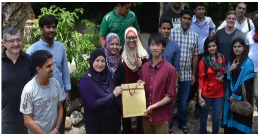
ISC (International Students Centre) のイベント