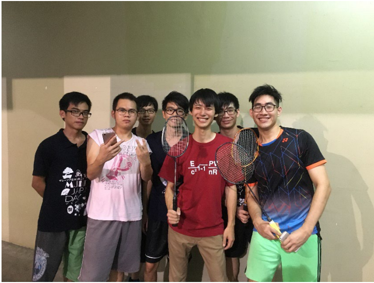
放課後友人とバドミントン