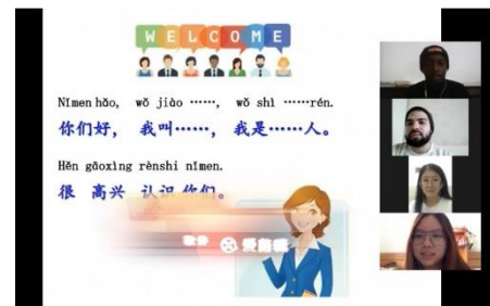
Demo of "A+" Beginning Level Class

◆ 研修内容 ：北京語言大学 2022年オンライン漢語課程 <短期漢語速成オンライン課程>