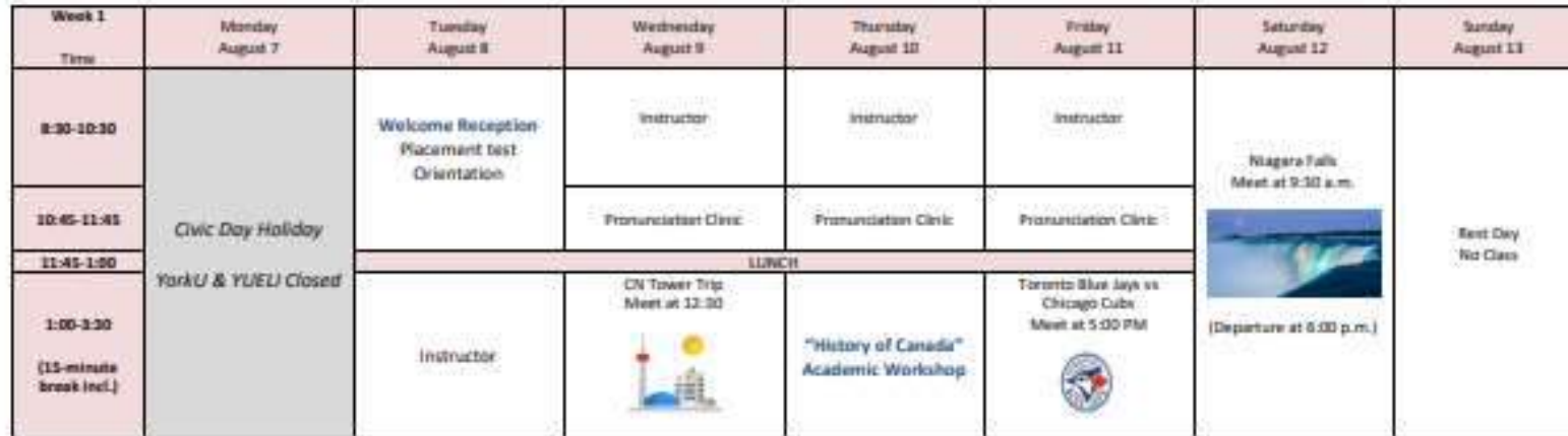
Summer Immersion Program: August 8-August 22, 2023