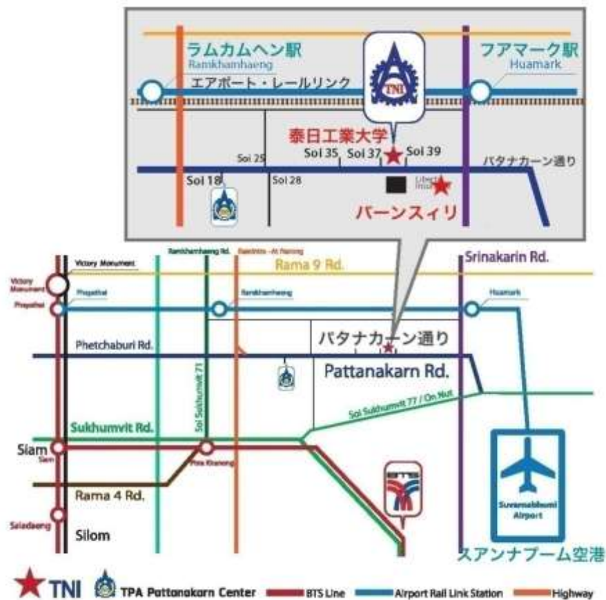
【泰日工業大学 (TNI) とバーンスイリの地図】