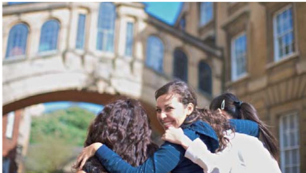
■ General English 一般英語の授業内容の例 ※クラスレベル、時期により内容は変わります。