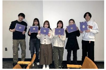
※2022年度参加学生からの提供写真