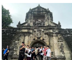
2022年度参加学生からの提供写真