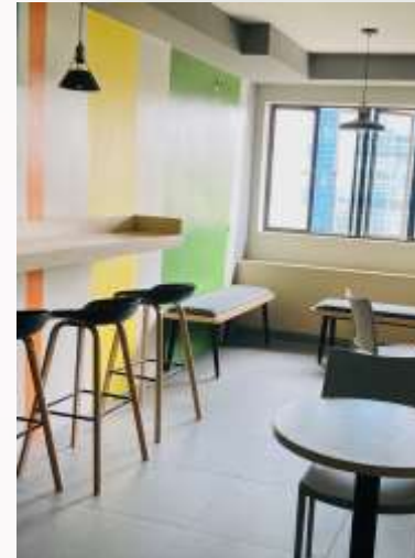
寮の共用スペース