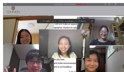
※2022 年度参加学生からの提供写真