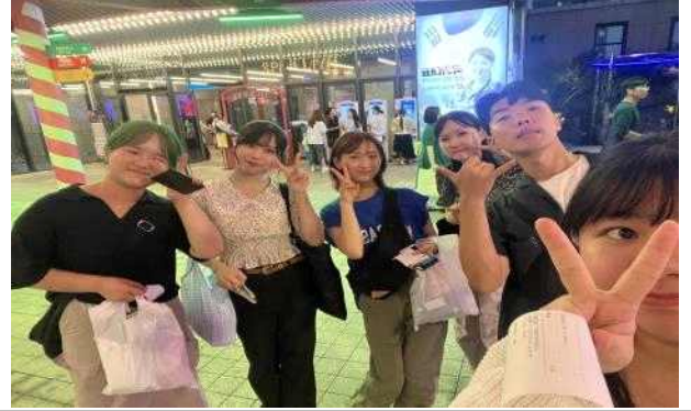
<DAEGU CITY TOUR>