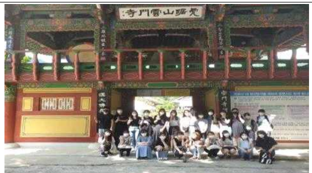
<清道 雲門寺 見学>