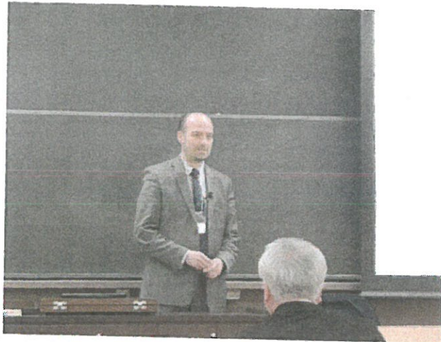
福美や学長からの主催校挨拶