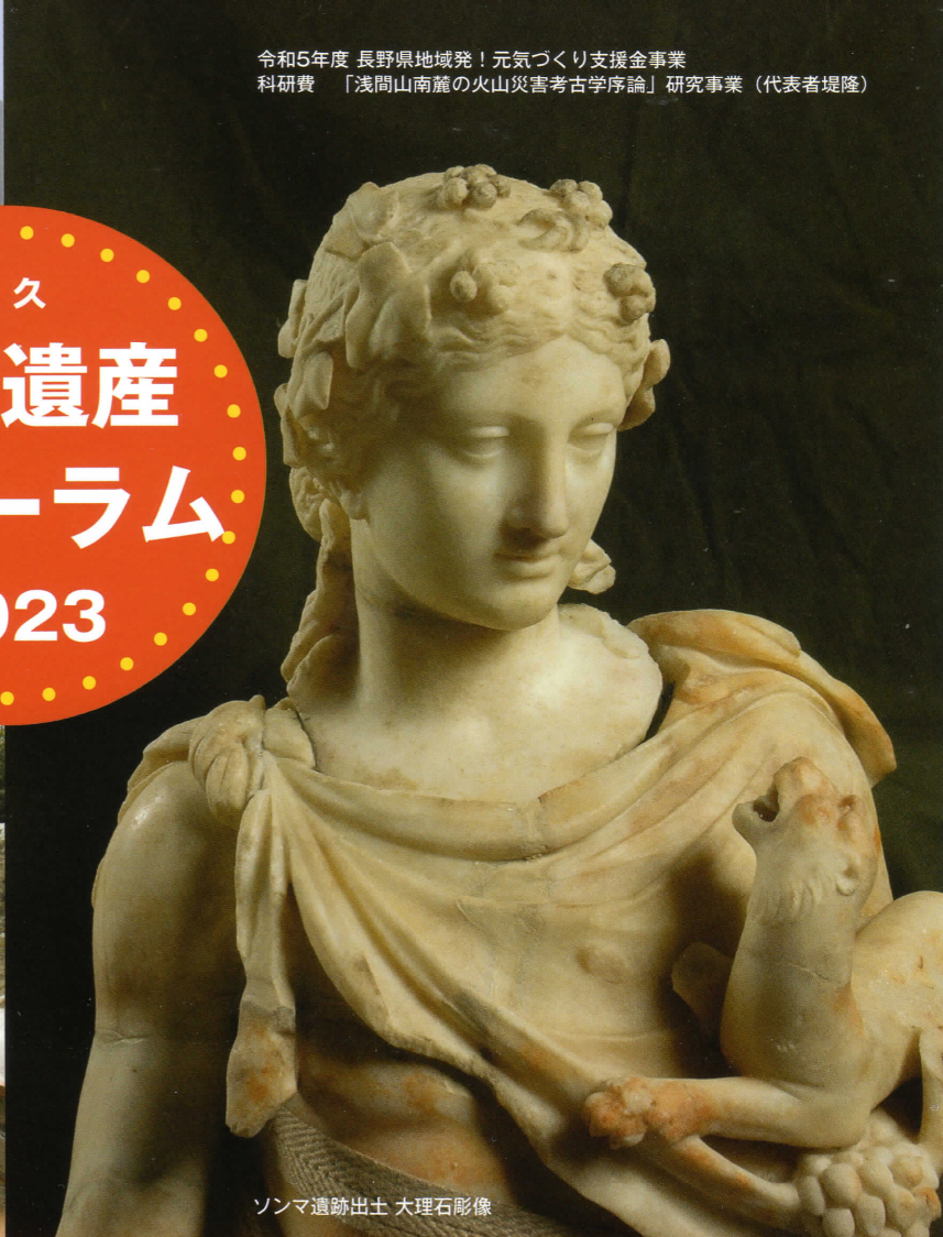
ソンマ遺跡出土 大理石彫像