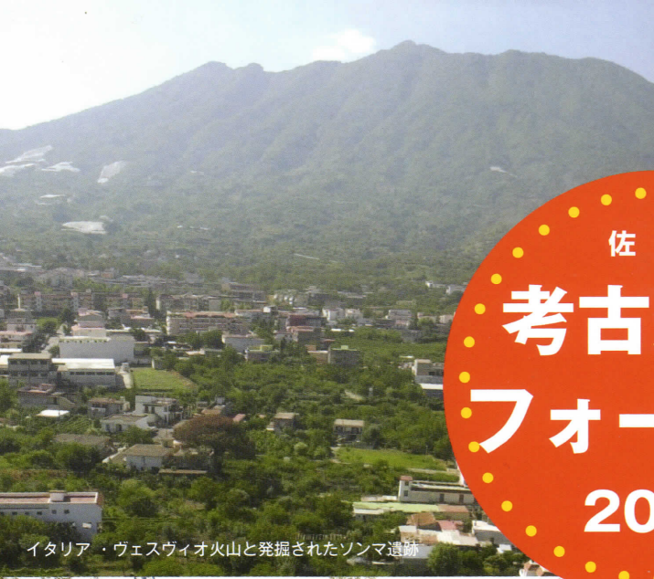
イタリア・ヴェスヴィオ火山と発掘されたソンマ遺跡