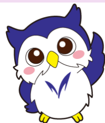
明治大学公式 キャラクター めいじろう