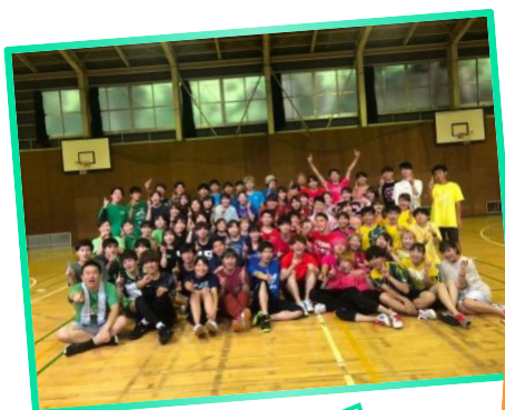
3キャン合同夏合宿