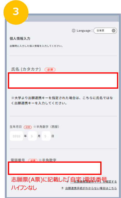
画面に従って個人情報を入力