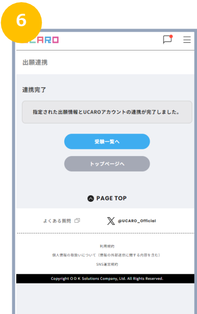
出願連携が完了しました。 「受験一覧へ」より受験番号を 確認してください。