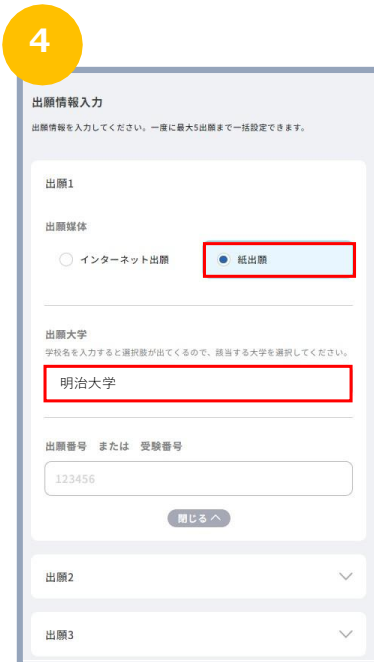
出願媒体は「紙出願」 出願大学は「明治大学」 を選択