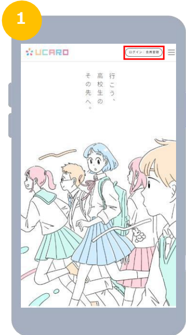
https://www.ucaro.net/ にアクセスし会員登録