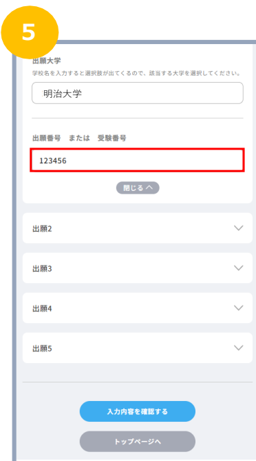
出願番号 または 受験番号の欄に 「受験番号」を入力し 間違いがなければ 「入力内容を確認する」を選択