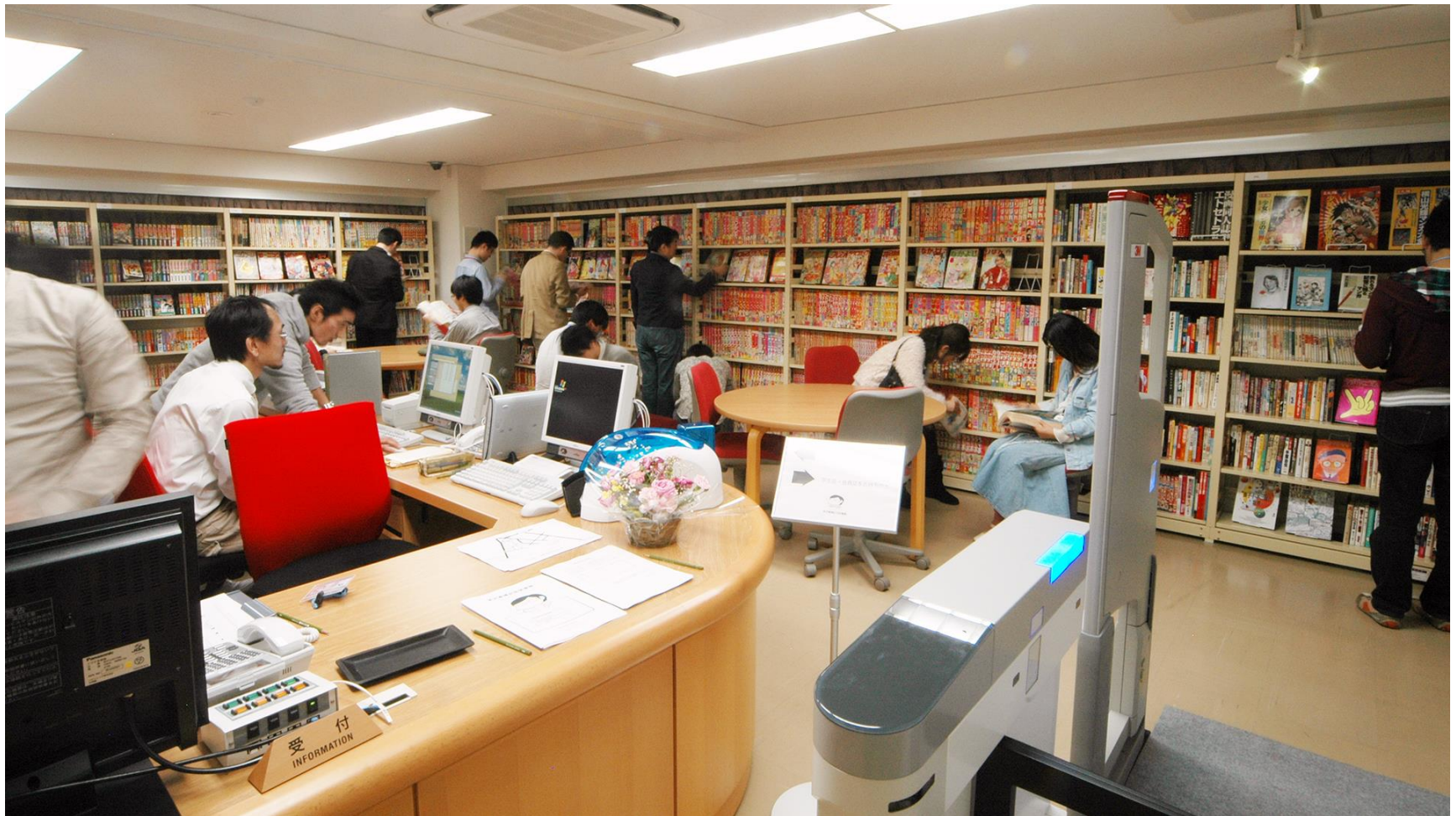
明治大学 米沢嘉博記念図書館

サブカルチャーともみなされてきた文化のアーカイブ構築 や、保存・運用に関する実践的研究も行います。