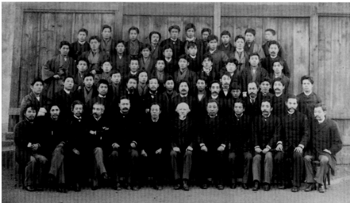
ボワソナードを囲んでの記念写真（明治期）

創立者の恩師でもあるボワソナード（前列中央）を中心に、3名の創立者、関係者、学生が見えます。