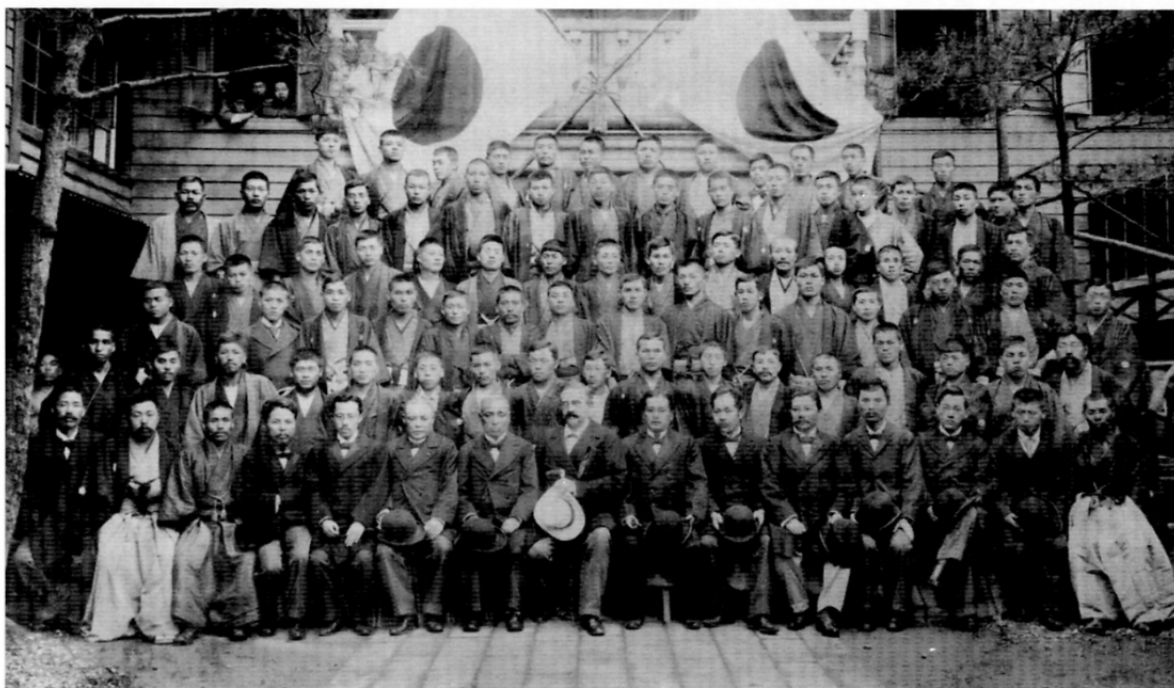
明治34年卒業記念写真（1901年）

創立者の恩師でもあるボワソナード（前列中央）を中心に、3名の創立者、関係者、学生が見えます。