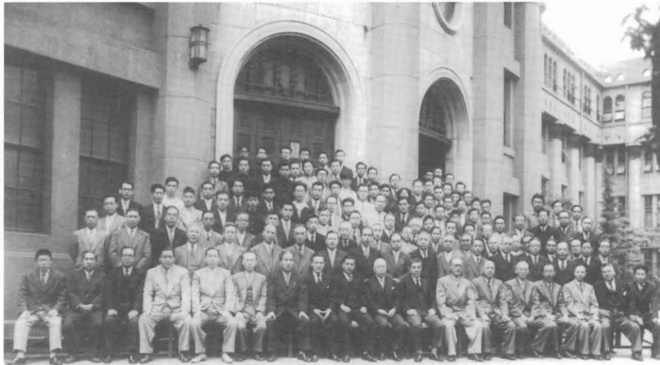
大学院入学記念（1954年）