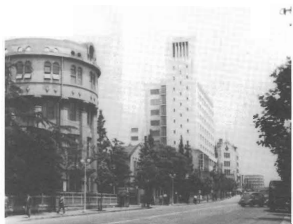
3代目記念館と大学院棟 （1954・昭和29年頃）

1953年4月，明治大学に日本の私立大学で初めての経営学部が設置されました。当初は生田キャンパスで授業をおこなっていましたが，1956年に駿河台キャンパスに移転，1960年からは1・2年生が和泉キャンパスに移転しました。