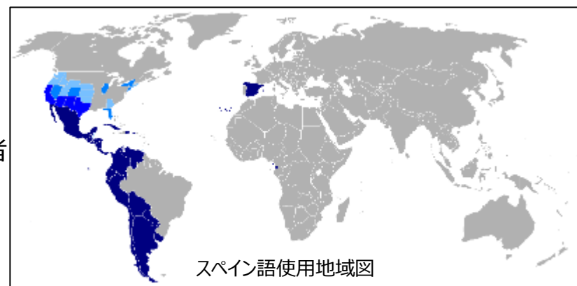
スペイン語使用地域図