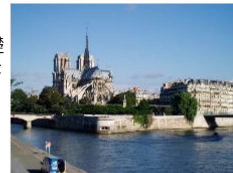
ノートルダム寺院とセーヌ河

1年次には、文法中心の授業を週1コマ、もう1コマをコミュニケーション重視の授業と分けて、基礎を徹底的に学びます。2年からは、中級フランス語の他に、実践・時事・資格・ゼミナールなど、多様な要望に応えられるような授業を設けています。仏検などの試験を受ける際の助成金も出るようになり、これまで以上のバックアップが期待できます。ネイティブの先生の中には母国で法律を学んだ先生もおられます。少人数で教わることもできますし、4年までフランス語の勉強を続けることもできます。