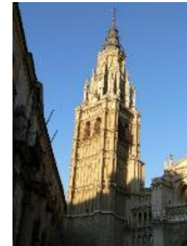
カテドラル（トレド）