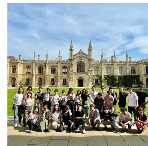
ケンブリッジ大学での法学研修

法学部では、ケンブリッジ大学（英国・夏期 4 週間） ハワイ大学（アメリカ・春期 2 週間）で、海外法学研修を実施しています。いずれのプログラムも、その国の法律を、英語による授業とフィールドトリップを通して学びます。プログラムの詳細は、法学部ウェブサイト参照してください。