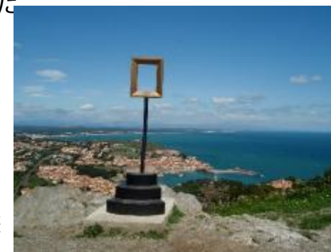
南仏モンブリエの海

現在明治大学では、リヨン政治学院、パリのINALCOなどフランス国内の他、ベルギーやカナダといったフランス語圏の大学へも協定留学が可能です。協定留学の制度を利用する場合、学内の試験はありますが、すべて自分で開拓しなければいけない個人留学と比べると、手続きなどの面で比較的苦労せずにすみ、その分学習面での準備に時間とエネルギーを充てられるというメリットがあります。また、以前その大学に留学していた先輩から体験談を聞いたりできるのも魅力のひとつでしょう。慎重に準備をすれば、経済的負担も少なくすませ、留年も避けることができます。他にも、難易度はあがりますが、フランス政府給費留学などの可能性もあります。協定留学の前に、フランス語短期研修から始めてもいいでしょう。