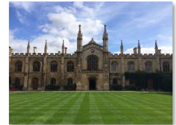
研修プログラム提携校のひとつ、ケンブリッジ大学

皆さんは、英語を勉強したい、しなければならないと思っていますか？ 答えが YES だとしたら——何のために？ 多くの人が、英語ができれば何かの役に立つはずだ、と漠然と思っているようです。しかし何の役に立つのか、具体的にはっきりと認識されている方は、案外少ないのではないのでしょうか。