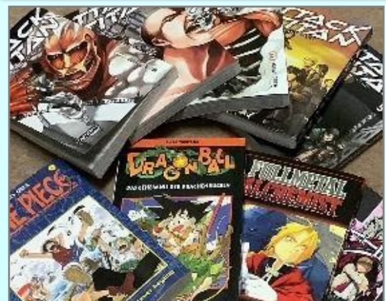
ドイツ語に翻訳された日本漫画