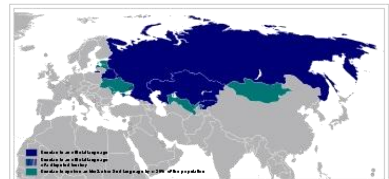
ロシア語話者の分布