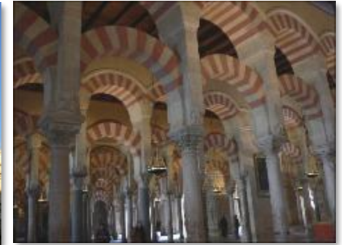
メスキータ（コルドバ）