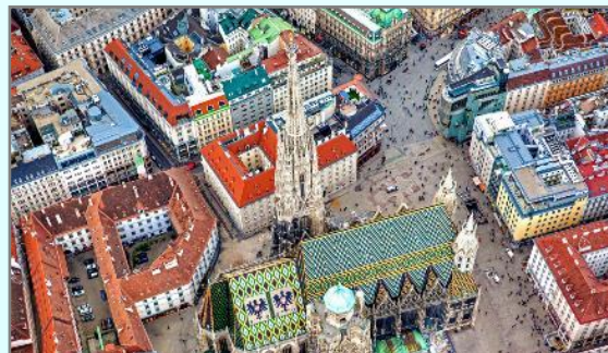
シュテファン大聖堂（ウィーン）