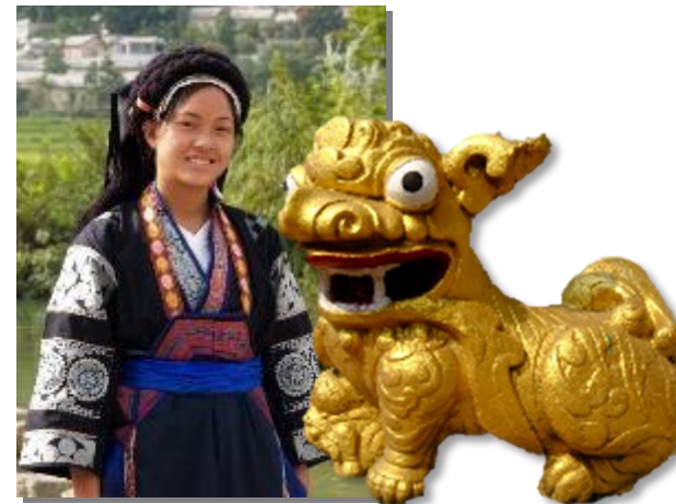
中国貴州省のプイ族の娘さん

日本が、アジアへ、そして世界に向けて正しい情報を発信してゆく上でも、中国語は英語と並び重要な外国語です。