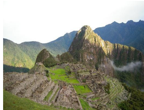
マチュピチュ（ペルー）

アルハンブラ宮殿，フラメンコ，マチュピチュ，サッカー，古代遺跡，タコス… スペイン語は、こうした広大なスペイン語圏の豊かな文化や歴史への関心を育み、知識を獲得し、そして現地の人々とコミュニケーションを取るための「はじめの一步」であり、その「極意」でもあるのです。