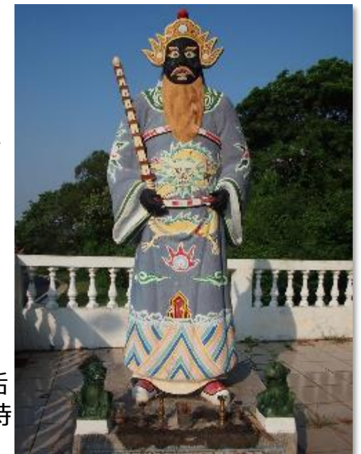
台湾の金門島の神像