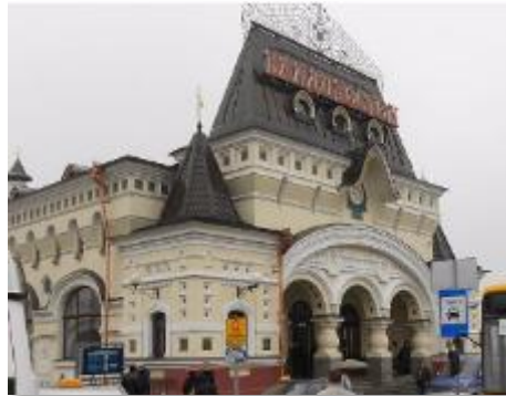
シベリア鉄道ウラジオストク駅

ロシアのウラジオストクへは飛行機で2時間半。 じつは日本から一番近いヨーロッパの街です。