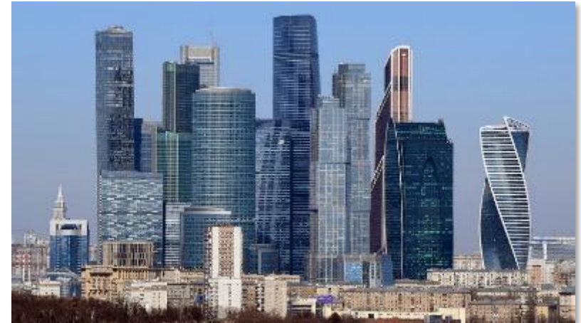
ロシア経済の新しい中心地「モスクワ・シティー」

単位が取れなかった場合、 同一年度での再履修はできません。 あらかじめご了承ください。