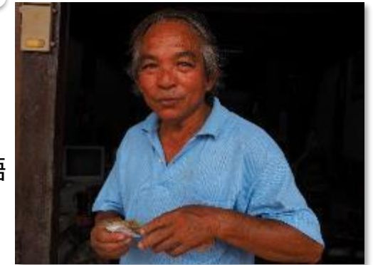
タイ、ランタイ島の華人

和泉キャンパスでは、1年生向けに初級中国語、2年生向けに中級中国語の授業を開講しています。希望者は、3年生以降も駿河台キャンパスで上級中国語の授業を受講できます。