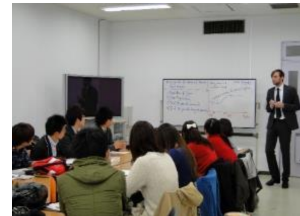
留学基礎講座 A の授業

留学基礎講座は、主に、海外法学研修及び長期留学をめざす学生のための科目です。1年生は、1年次配当の「留学基礎講座 A」を履修することが、法律を英語で学ぶための第一歩です。留学基礎講座 A は、4月初めに実施するTOEICのスコアによる選考があります。詳細は、法学部から配信される案内・掲示などを参照してください。