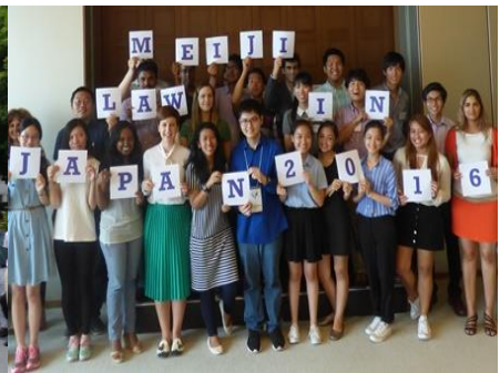
参加者との交流を深めるパーティー