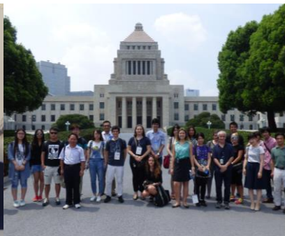
法の現場を知るフィールドトリップ