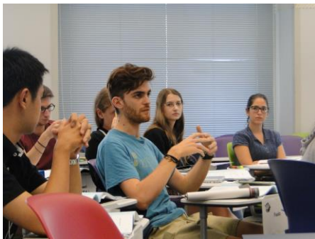
英語で行われる講義