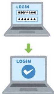
基本認証（レガシー認証）