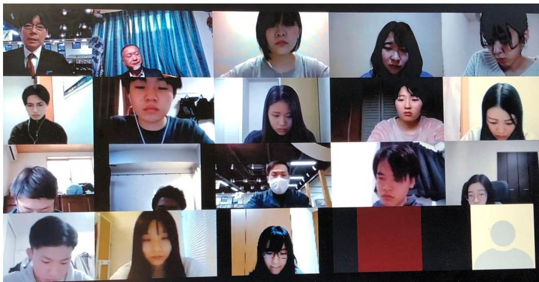
ZOOM ミーティング写真

http://www.yoshikawa-group.co.jp/company/