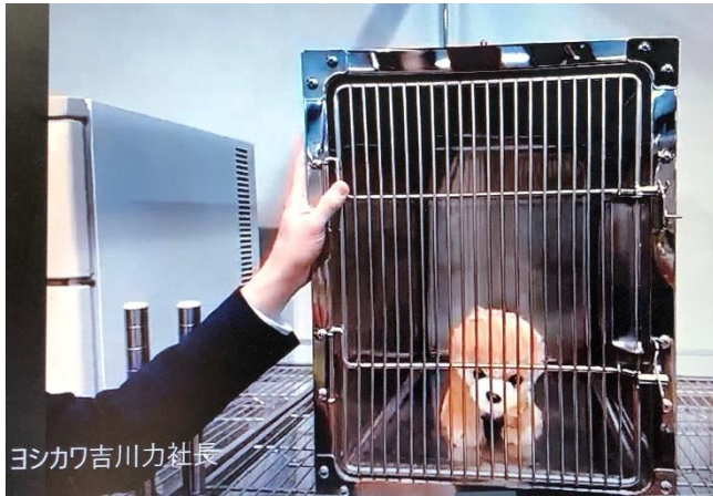
ステンレス製 犬 のケース