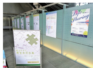
アカデミーコモン1階展示スペース