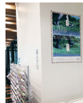
中野キャンパスでの掲示の様子