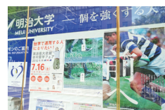
アカデミーコモンでの掲示の様子